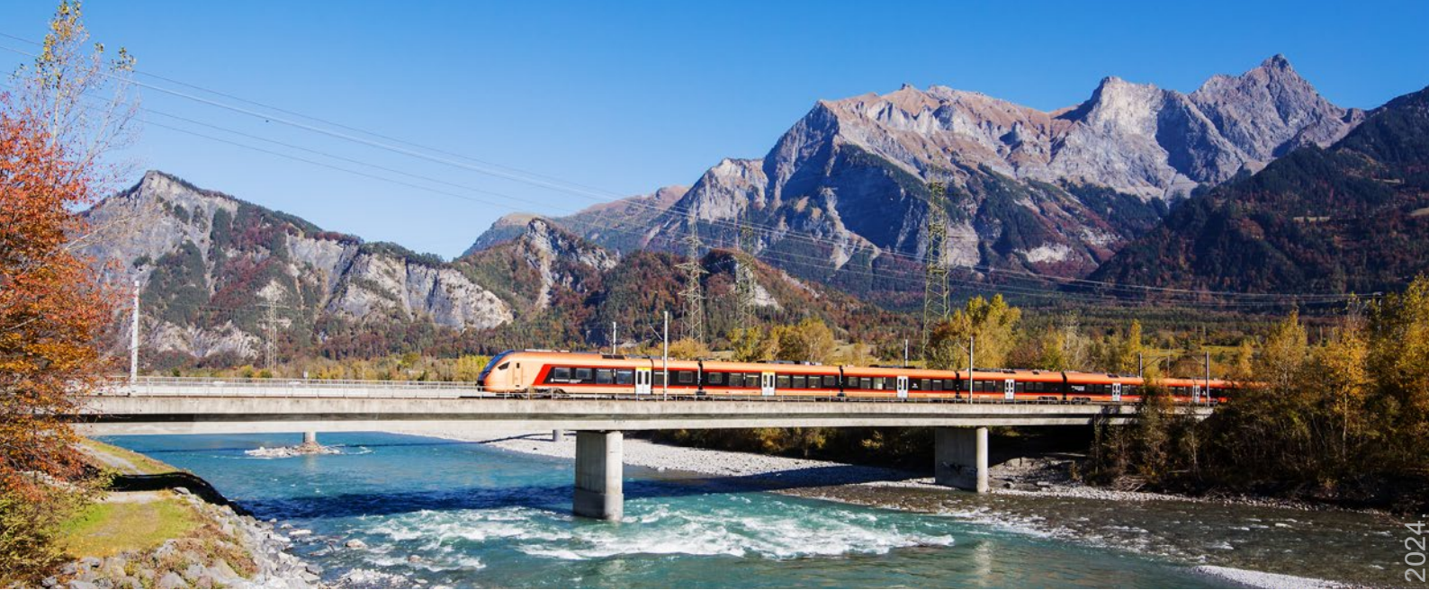
Abb. 1: Ein SOB-Flirt der neuen Direktverbindung Aare Linth (Bern–Landquart–Chur) überquert den Rhein bei Sargans.