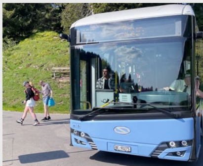
Abb. 8: Die neue E-Postautoverbindung von Saanen nach Abländschen und Jaun erschließt ein attraktives Wandergebiet.