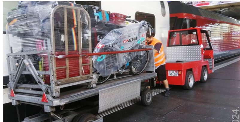
Abb. 6: Fahrrad- und Gepäckverlad in das Gepäckabteil des Doppelstock-IR Luzern–Bern–Genf Flughafen.