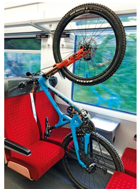
Abb. 7: Optimal fürs Mountainbike, aber keine Lösung für den Fahrradboom...

Verkehren in der Schweiz Speisewagen und bediente Bistros in nahezu allen InterCity und einigen InterRegio, so gab es bis vor kurzem in den für den Freizeitverkehr wichtigen Regio-Express-Zügen keine Möglichkeit zur Verpflegung. Die SOB und die BLS haben in ihren neuen Interregio-Flotten einen Bistrobereich mit gekühlten und heißen Getränken und Snackautomaten sowie im angrenzenden Wagenteil Tische einbauen lassen. Gemäß Auskünfte beider Bahnunternehmen bewähren sich die Verpflegungszonen und sind finanziell selbsttragend. Der Grund darin dürfte einerseits in der hohen Qualität der Produkte und an-