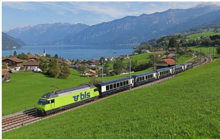
Abb. 2: Der Meterspur-Golden-Pass-Express wird gezogen von einer BLS-Normalspurlok. Hier oberhalb des Thunersees zwischen Interlaken und Spiez.