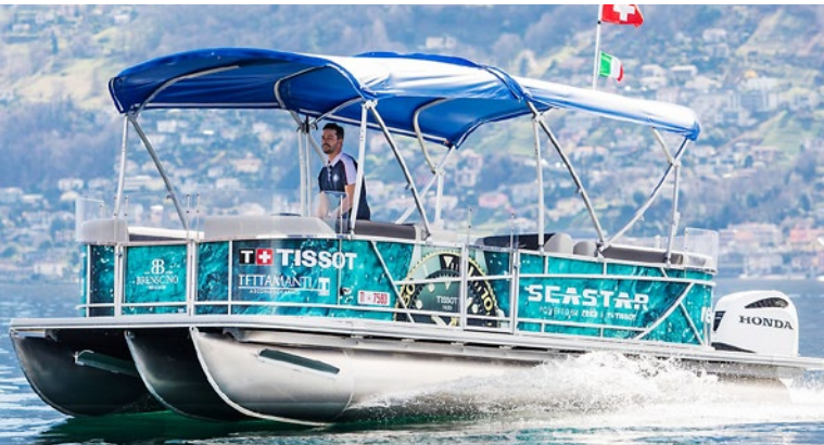
Abb. 5: Die „Seestar“ verkehrt für Hotelgäste auf dem Lago Maggiore zwischen Locarno und Brissago.