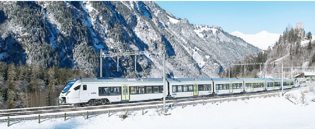
Abb. 3: MIKA-Regio-Express der BLS in Doppeltraktion auf der Lötschberg-Nordrampe bei Blausee.